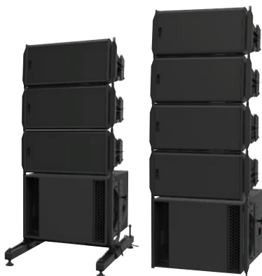
Le LS18 servant de base à un ensemble de GEO S12 posées au sol.