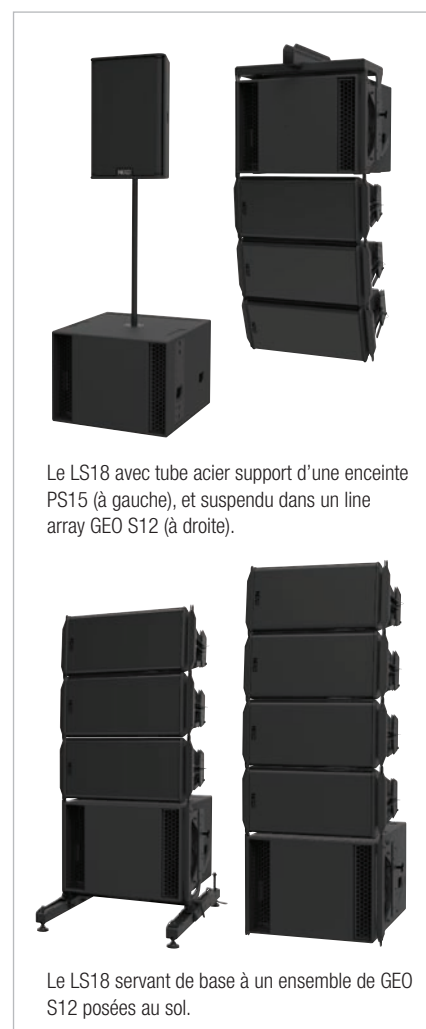
Le LS18 avec tube acier support d'une enceinte PS15 (à gauche), et suspendu dans un line array GEO S12 (à droite).

Le LS18 peut se suspendre en compagnie de PS15, ce qui est particulièrement intéressant pour les installateurs.