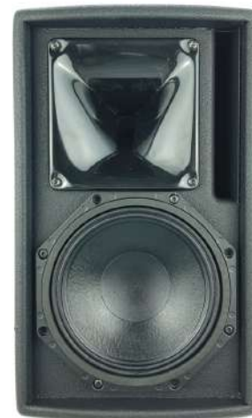
Une fois la grille retirée, le large pavillon PS utilisé avec le haut-parleur d'aigus est visible sur la photo ci-dessus.

La réponse en phase de l'enceinte ePS8 est la réponse signature de NEXO, permettant une compatibilité avec toutes les autres enceintes NEXO (sauf les configurations de retour de scène dont la latence est réduite).