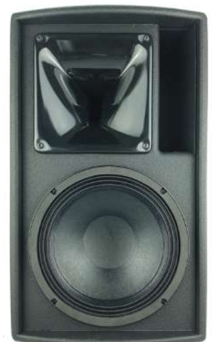
Une fois la grille retirée, le large pavillon PS utilisé avec le haut-parleur d'aigus est visible sur la photo ci-dessus.

La réponse en phase de l'enceinte ePS10 est la réponse signature de NEXO, permettant une compatibilité avec toutes les autres enceintes NEXO (sauf les configurations de retour de scène dont la latence est réduite).