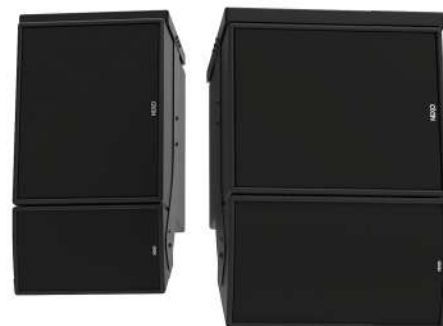
Caisson eLS600 couplé avec l'enceinte ePS8 (gauche) ou ePS10 (droite)

Le caisson eLS600 partage la même réponse en phase que les autres enceintes NEXO. Il est donc très facile de le conjuguer à d'autres systèmes NEXO, ou avec n'importe quel caisson de graves NEXO, sans que cela présente un risque de filtrage en peigne ou nécessite un réglage électronique complexe.