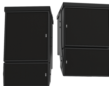
Caisson εLS400 couplé avec l'enceinte ePS6 gauche) ou ePS8 (droite)

Le caisson εLS400 partage la même réponse en phase que les autres enceintes NEXO. Il est donc très facile de le conjuguer à d'autres systèmes NEXO, ou avec n'importe quel caisson de graves NEXO, sans que cela présente un risque de filtrage en peigne ou nécessite un réglage électronique complexe.