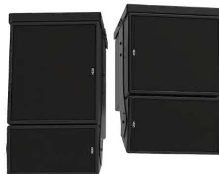
Caisson eLS400 couplé avec l'enceinte ePS6 gauche) ou ePS8 (droite)

Le caisson eLS400 partage la même réponse en phase que les autres enceintes NEXO. Il est donc très facile de le conjuguer à d'autres systèmes NEXO, ou avec n'importe quel caisson de graves NEXO, sans que cela présente un risque de filtrage en peigne ou nécessite un réglage électronique complexe.