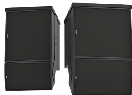
Caisson eLS18 couplé avec l'enceinte ePS10 (gauche) ou ePS12 (droite)

Le caisson eLS18 partage la même réponse en phase que les autres enceintes NEXO. Il est donc très facile de le conjuguer à d'autres systèmes NEXO, ou avec n'importe quel caisson de graves NEXO, sans que cela présente un risque de filtrage en peigne ou nécessite un réglage électronique complexe.