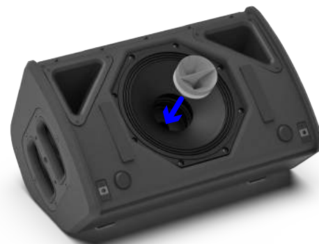
Une fois la grille retirée, un pavillon magnétique optionnel peut rapidement être installé de manière à changer la directivité pour passer de 100° x 100° à 110° x 60°

La réponse en phase de l'enceinte P8 est la réponse signature de NEXO, permettant une compatibilité avec toutes les autres enceintes NEXO (sauf les configurations de retour de scène dont la latence est réduite).