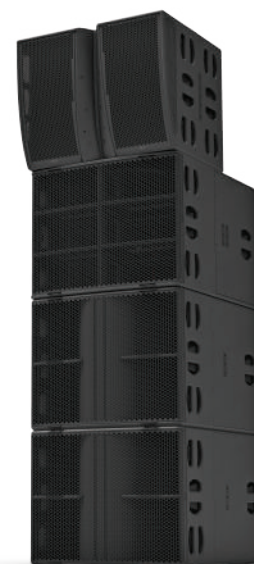
Système Alpha+ typique avec 2 caissons de graves L20, 1 module de basses B218 et 1 module principal M210, le tout amplifié par un seul NXAMP4x4mk2.

Un soin particulier a également été apporté au réglage du délai de groupe du système Alpha+ pour garantir un son clair sur l'ensemble du spectre tout en conservant la facilité d'utilisation de l'interopérabilité avec d'autres produits NEXO.